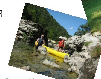
Canoë Kayac et baignades dans les Gorges du Tarn ou de la Dourbie