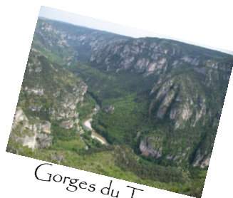
Gorges du Tarn