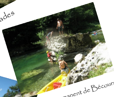
Le permanent de Bécours en pleine action !